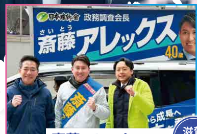
滋賀1区 斎藤アレックス議員